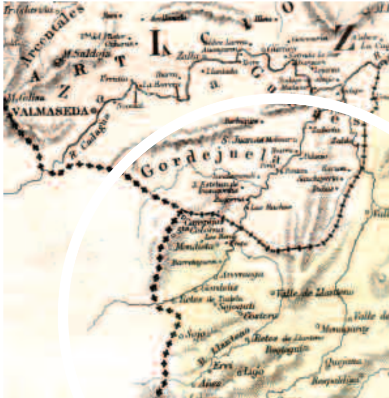
Luis Luciano Bonapartek 1888an egindako Euskal Herriko maparen xehetasuna

Además de dulzainero (tocaba la dulzaina con las manos en posición de izquierdas), fue pastor, agricultor, carretero, carbonero, empresario musical e incluso concejal de Gordexola antes de la Guerra Civil.