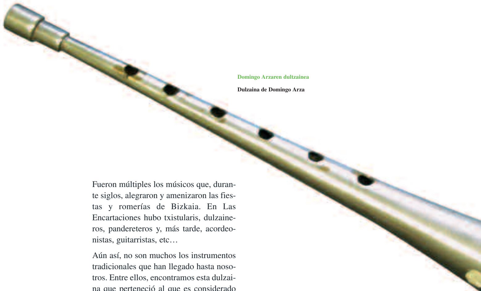
Domingo Arzaren dultzaina