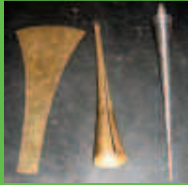
Txantiloia, txantiloia tolestua eta moldea