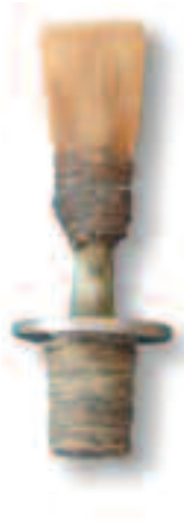
Domingo Arzak erabilitako piteak