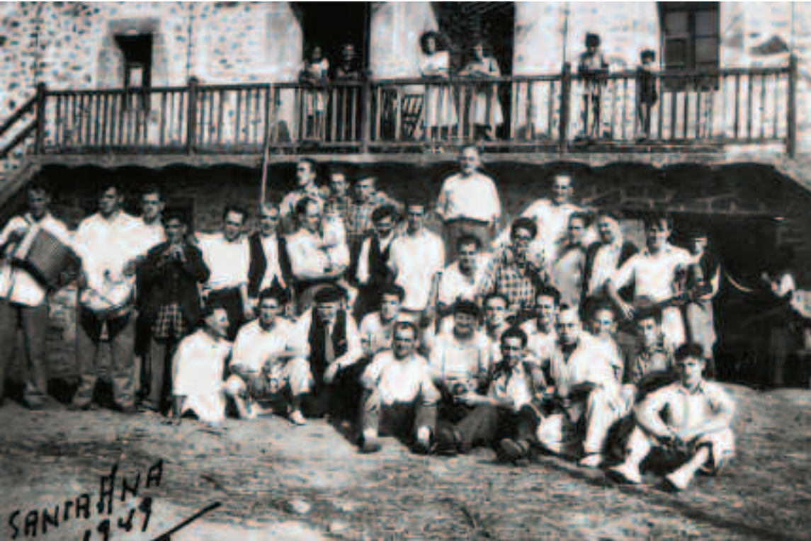
Erromerian Santa Ana (Gordexola)